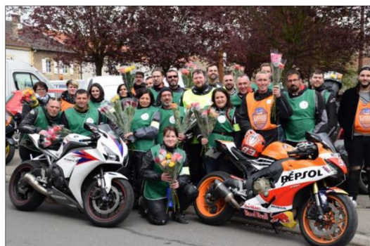
Motards et passagères fin prêts, roses à la main !

Ce dimanche après-midi, arrivés en cortège, les motards et leurs passagères de l'association Une rose, un espoir du secteur d'Algrange, ont circulé à moto dans les rues de Manom. Les bras chargés de roses, ils sont passés de porte en porte afin de proposer aux habitants une rose, en échange d'un don minimum de deux euros. Certains étant postés à des endroits stratégiques, visibles des automobilistes de passage, ont été sollicités par